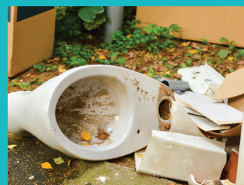
Gravats (meubles, sanitaire, produits de démolition...)