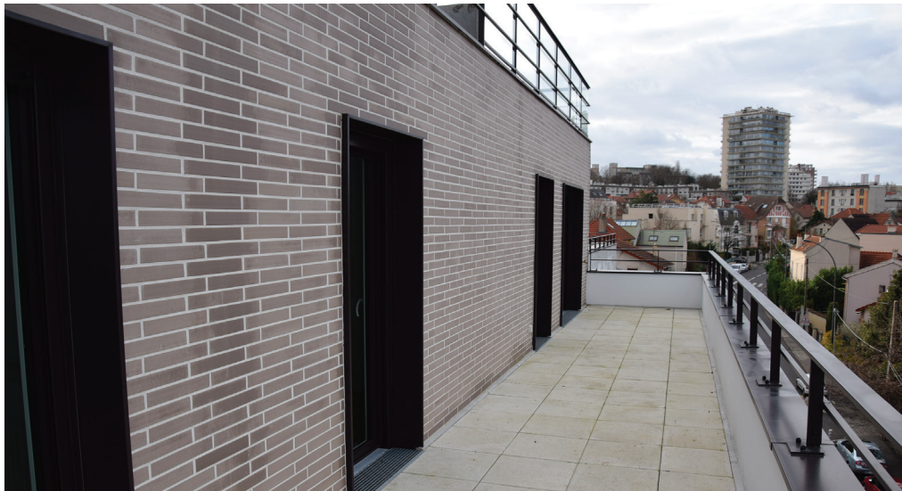
Un balcon à la surface généreuse.

Tout en travaillant à améliorer le confort des logements existants, Vallée Sud Habitat mène également une politique d'acquisition de biens de qualité neufs pour répondre à la demande la plus large possible.