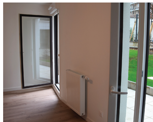
Un appartement avec jardinet.

Si la façade extérieure de la Villa Flore est particulièrement esthétique grâce à ses briquettes mates et vernissées, l'intérieur des appartements est lui aussi très agréable avec des prestations de qualité. Les quinze appartements acquis par Vallée Sud Habitat offrent de belles surfaces dont les intérieurs ont été réfléchis pour être baignés par la lumière naturelle et offrir un sentiment de bien-être immédiat. ●●●