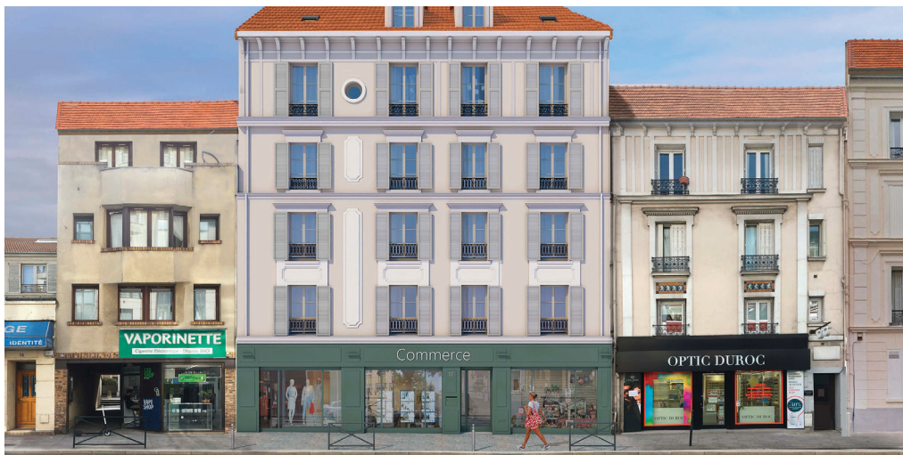
Restructuration de l'immeuble du 17 rue Paul-Vaillant-Couturier à Clamart

L'habitat ancien est quelquefois délaissé et dégradé. Il n'en recèle pas moins souvent un potentiel considérable. C'est pourquoi Vallée Sud Habitat mène des opérations de requalification des anciens logements pour offrir à tous un habitat de qualité, sûr et accessible.