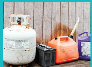
Déchets dangereux (batterie, peintures...)