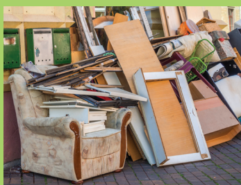
Encombrants (meubles, bois, ferraille, literie...)