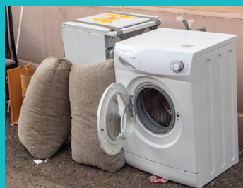
DEEE (matériel informatique, électroménagers...)